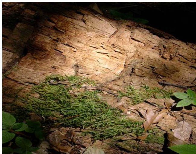
ภาพที่ 10. ลักษณะเนื้อไม้ภายหลังถูกเชื้อราเข้าทำลาย