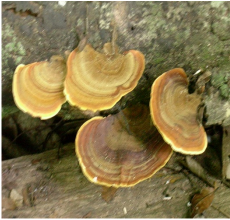
ภาพที่ 1. Stereum sp.