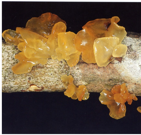
ภาพที่ 2. Tremella sp.