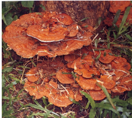
ภาพที่ 4. Ganoderma lucidum