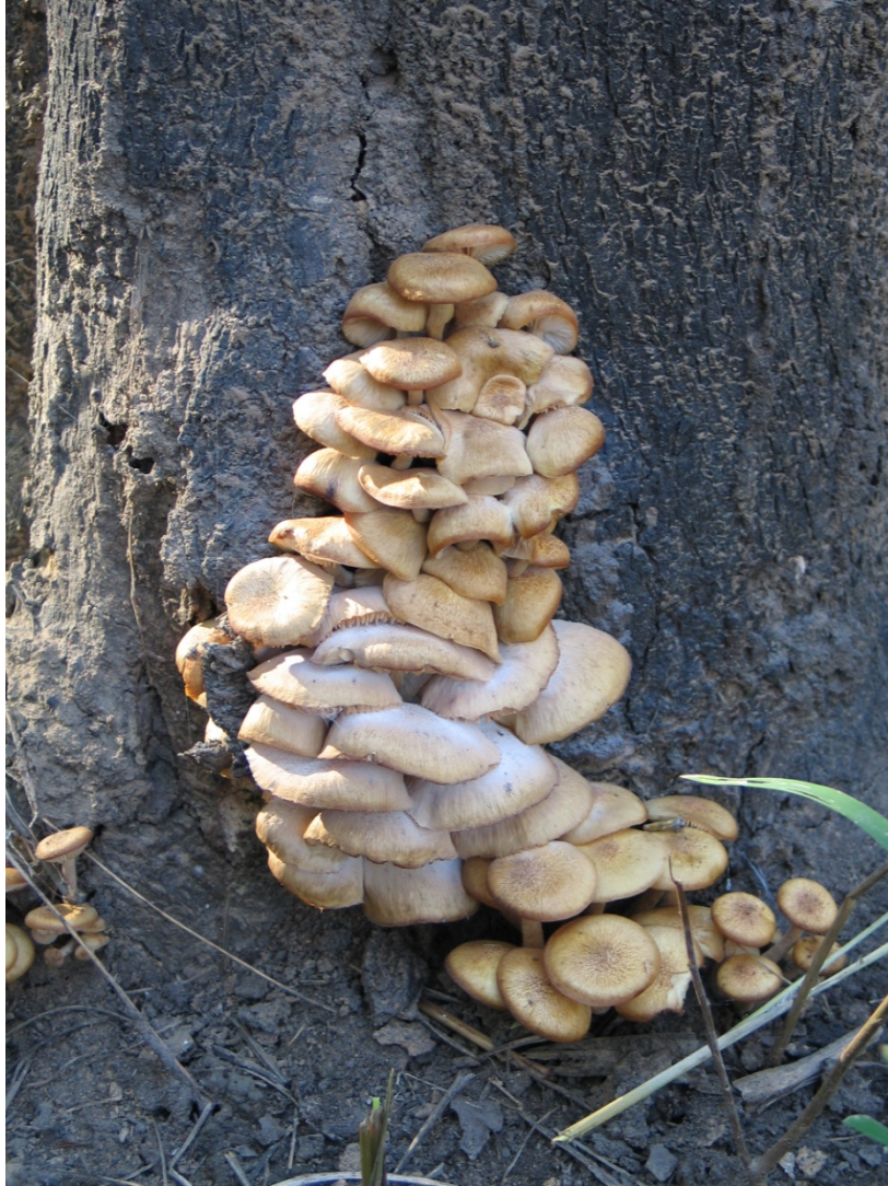
ภาพที่ 9. กลุ่มดอกเห็ดที่ทำลายไม้ ปล่อยผงสปอร์สีขาว