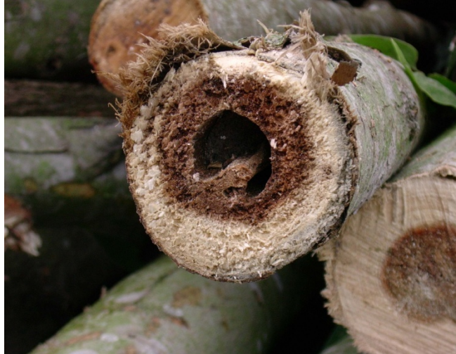
ภาพที่ 11. ลักษณะการเกิดไส้เน่าจากการทำลายของเชื้อรา