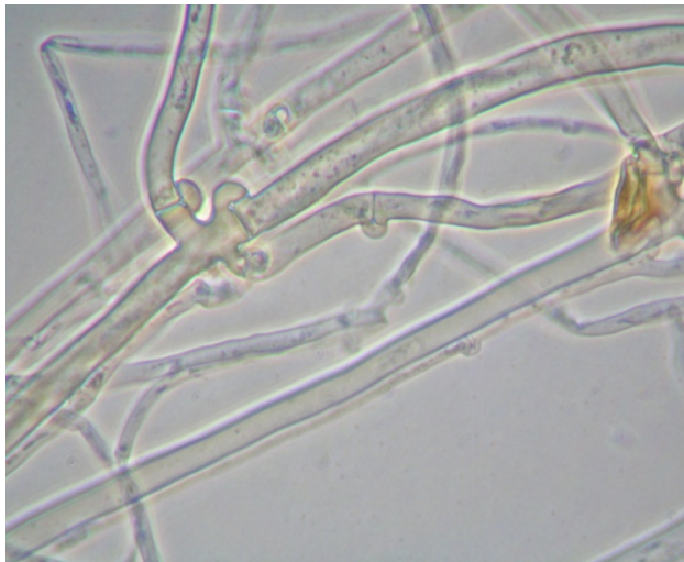
ภาพที่ 12. ลักษณะเส้นใยของเชื้อราภายใต้กล้องจุลทรรศน์