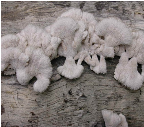
ภาพที่ 3. Schizophyllum commune