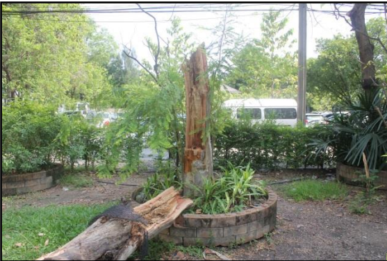
โรคลำต้นผุเน่า