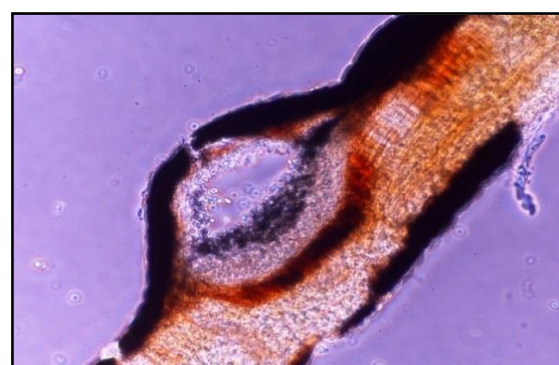
เชื้อรากลุ่ม Ascomycetes