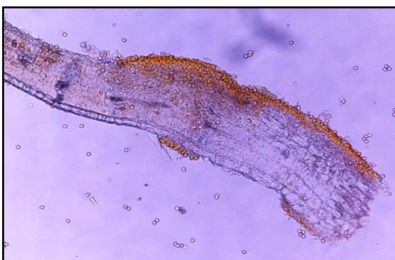
เชื้อ Maravalia pterocarpi