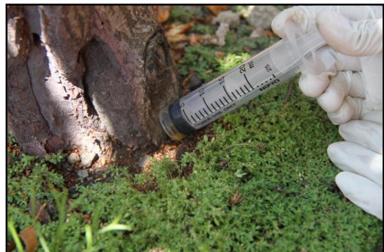
ฉีดสารกำจัดแมลงเข้ารูเจาะเข้าทำลายของแมลง