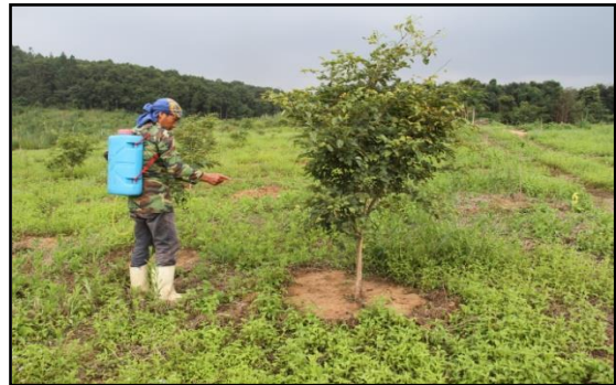
การฉีดพ่นสารเคมีที่ใบและลำต้น