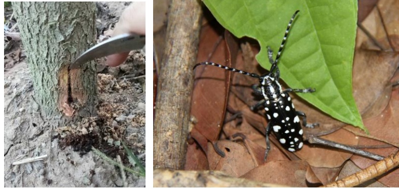
ด้วงหนวดยาว ( Threneticus lacrymans )