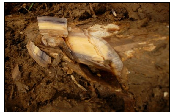
โรครากเน่า

เมื่อพบปัญหาจากโรค สิ่งแรกที่ต้องปฏิบัติ คือ ต้องตรวจสอบว่าเกิดจากโรคหรือไม่ หากเป็นโรคต้องจำแนกว่าเป็นโรคที่เกิดจากสิ่งมีชีวิตหรือสิ่งไม่มีชีวิต โดยตรวจดูลักษณะอาการโดยทั่วไปและการเปลี่ยนแปลงของต้นไม้ เช่นเปลือกหลุดร่อนไม่เป็นธรรมชาติ ยางไหล รากเน่า โคนต้นเน่า ใบเป็นจุด ใบไหม้ ใบเหี่ยว ใบเหลืองต่าง เกิดปุ่มปม เป็นต้น จากอาการที่ผิดปกติ โดยใช้แว่นขยายตรวจดูบริเวณรอยแผลเบื้องต้น เพื่อตรวจดูส่วนขยายพันธุ์ของเชื้อ (fruiting body) ที่ปรากฏ และตรวจดูภายในเนื้อเยื่อพืชด้วยกล้องจุลทรรศน์ ซึ่งเป็นส่วนที่บ่งบอกได้ถึงโรคพืชที่เกิดจากสิ่งมีชีวิต ส่วนโรคพืชที่เกิดจากสิ่งไม่มีชีวิต ลักษณะแผลจะมีสีสม่ำเสมอ ไม่มีจุดดำหรือปุ่มนูนบริเวณแผล จะปรากฏอาการทันที ไม่ต้องใช้เวลานาน ไม่มีการขยายลุกลามของแผลภายในต้นเดียวกัน เมื่อตรวจด้วยกล้องจุลทรรศน์ จะไม่พบเชื้อหรือส่วนของเชื้อบริเวณแผล