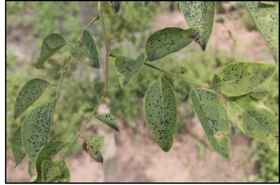
โรคใบจุดหนูนดำ(tar spot)