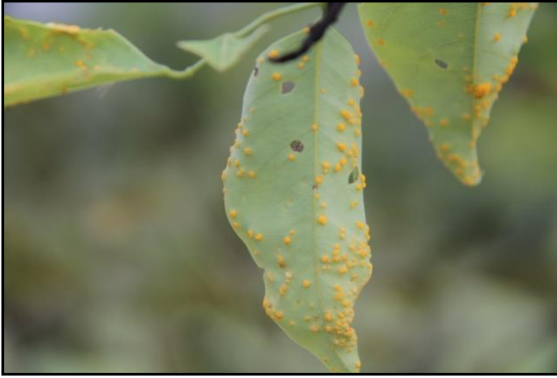
โรคราสนิม(rust)