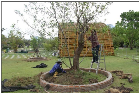
ตัดแต่งกิ่งที่มีโรคและแมลง