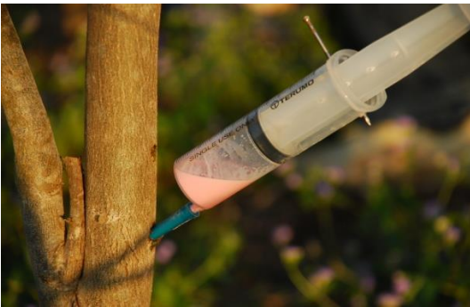
การฉีดสารเคมีเข้าลำต้น( trunk injection)

๔. การรักษาด้านไม้ที่เป็นโรค มีหลายวิธี เช่น ต้นไม้ที่เป็นโรคโคนเน่าหรือรากเน่า รักษาโดยการใช้สารเคมีประเภทดูดซึม เช่น phosphorous acid ฉีดพ่นทางใบ ลำต้น หรือใช้วิธีการฉีดเข้าลำต้น(trunk injection) เพื่อให้สารเคมีเคลื่อนย้ายไปตามท่อน้ำของพืช ในส่วนของต้นไม้ใหญ่ ถ้าพบการเข้าทำลายของเชื้อราทำให้เกิดโพรงบาดแผล ต้องรีบกำจัดเชื้อรา และโบกปูนปิดแผล และยังสามารถใช้สารชีวภัณฑ์รักษาโรคพืชได้ เช่น เชื้อรา Trichoderma spp. รักษาโรครากเน่าโคนเน่า โรคเหี่ยว เป็นต้น