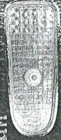
รอยพระพุทธบาททองคำและเงินกะโหลกของพระคัมภีร์ ษคัมภีร์ของอาณาจักรอยุธยา รัชกาลสมเด็จพระเจ้าอยู่หัวบรมโกศ ษสมัยของวัดพระพุทธบาทราชวรมหาวิหาร อ.สระบุรี ษ(ต้นแบบของเหรียญรุ่นนี้)

สปีดสูงในสมัย พระเจ้าบรมโกศ ทรงมีความ ษวางใจนิยมใฝ่รอยพระพุทธบาทสระบุรียิ่ง เสด็จไป ษร่วมเสด็จรื้อรอยพระพุทธบาทสระบุรีทุกปี ไปตรา ษทับลงพระตำราสำหรับประสูติพระมณฑปทั้ง ษในไทย พระเจ้าบรมโกศ ได้พบทองคำที่ ษมีอายุหลายพันปี แลวงเมืองกุญบุรี จึงทรง ษนำทองคำ 90 ชั่ง ทุ่มยอดพระมณฑป และ ษนำทองคำรอยพระพุทธบาททองคำ ประดับด้วย ษสีต่างอย่างถึง 108 ไร่ด้วย นับเป็นงานช่าง ษศิลป์รวมลือลืออยู่ยงที่มีความวิจิตรบรรจงงดงาม ษยิ่ง