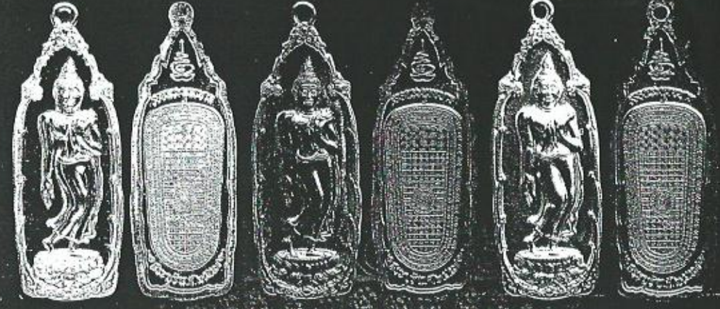
เนื้อเงิน เนื้อนวลโลหะ เนื้อทองแดงกะโหลก

รอยพระพุทธบาทที่ทำเป็นลายมงคล 108 ก็ ษเพื่อนแสดงให้เห็นว่าพระพุทธเจ้าองค์ประเสริฐที่สุด มี