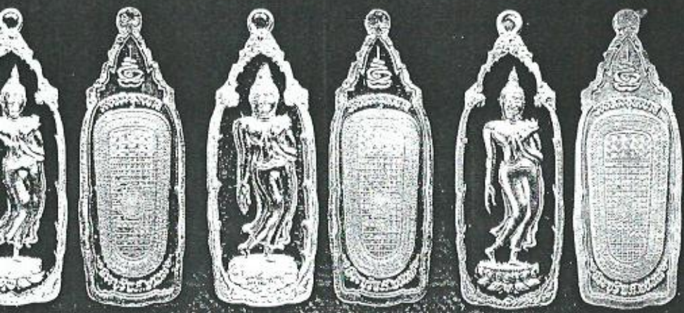
เนื้อทองคำลงยา เนื้อทองคำ เนื้อเงินลงยา

โดยพระพุทธบาท สระบุรี ที่สถิตอยู่ ณ สุวรรณคัมภีร์ คัมภีร์ในสมัยพระเจ้าทรงธรรม (หรือกล่าว แห่งกรุงศรีอยุธยา) นับว่าเป็นขอรอย ษบาทที่มีความศักดิ์สิทธิ์ยิ่ง เป็น ษบาทที่มีลายลักษณ์อักษรการ ษด้วยมงคลร้อยแปดประการ มี ษบาทปริศนารึที่แสดงถึงภาพประติมา ษพระพุทธบาท ให้ปรากฏเป็นอสงว ษเรียวกว่าเหล็กเจดีย์ใดๆ เคียงสอง ษประจักษ์แก่ "พราหมณ์" เมื่อครั้งยกไป ษน้ำ ได้ชิงลูกดอกโศกเมื่อขาดเจ็บหนักไป ษแล้วสักครู่เนื้อคัมภีร์ก็องกรมาเป็นปกติ ษแผลหรือบาดเจ็บแต่อย่างใด เมื่อพิรา ษเข้าไปดูก็พบรอยพระพุทธบาทปรากฏในศิลา ษคล้ายรอยเท้าคน มีน้ำขังอยู่ "พราหมณ์" ษขาดแคลนของทางที่ถูกอิงคองหายเพราะคัม ษวังน้ำคงดูหาตัวที่เป็นกลางเกลื่อนในตัว ษหายไปสืบ เมื่อเจ้าเมืองสระบุรีสอบสวน ษรอยพระพุทธบาทตามคำสั่งของพระเจ้า ษ ก็ได้เสด็จจากพราหมณ์ จึงได้แจ้งไป ษหรืออยุธยาตั้งแต่ครั้งนั้น จึงได้ประจักษ์รอย ษบาท สระบุรี ตั้งแต่นั้นมา