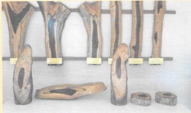
ไม้พะยุงที่ยืนต้นตาย นำมาใช้ให้เกิดประโยชน์ในเชิงวิชาการและจัดแสดง เพื่อให้เห็นลักษณะทางกายภาพของไม้พะยุง