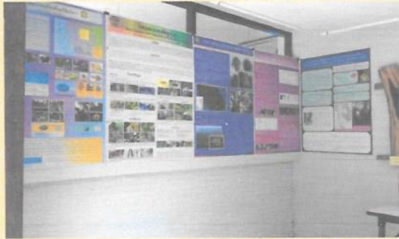
แสดงงานวิชาการของไม้พะยุงในประเทศไทย